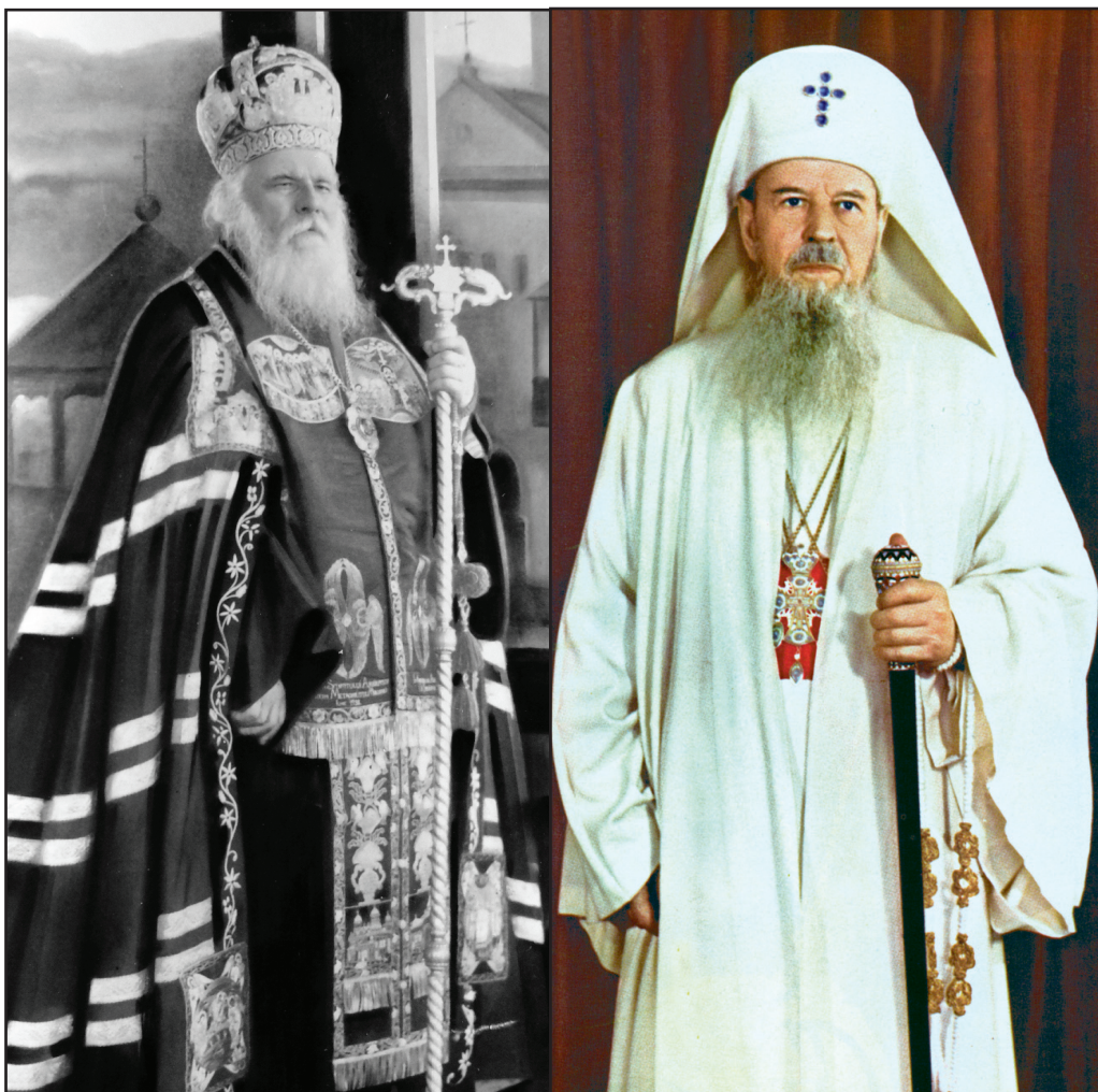
Patriarhii României Nicodim Munteanu (1864-1948) și Iustin Moisescu (1910-1986)